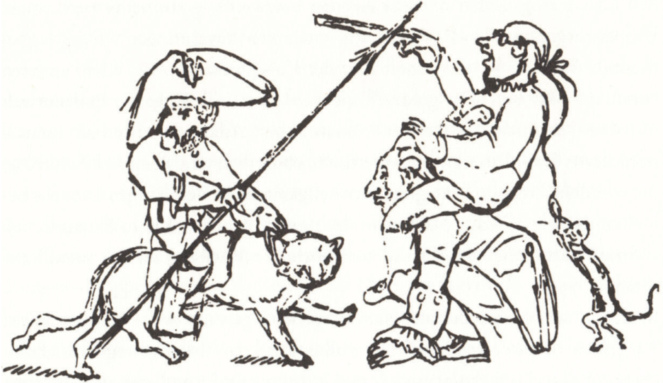
Hoffmann et le chat Murr en lutte contre la bureaucratie prussienne, dessin d'E. T. A. Hoffmann, 1820/21